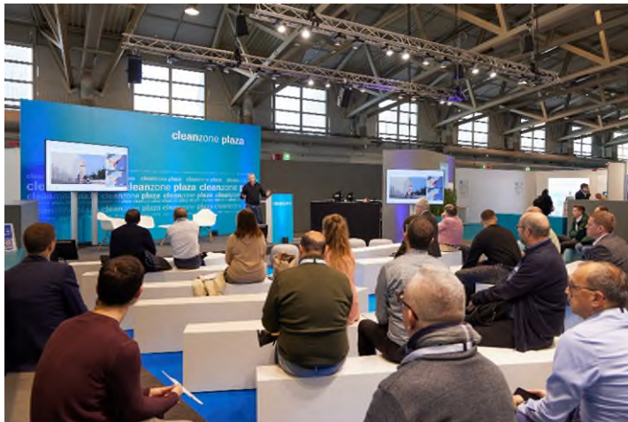
Die Cleanzone Conference greift aktuelle Branchentrends auf.

Das vollständige Konferenzprogramm ist unter www.cleanzone.messefrankfurt.com/programm abrufbar.