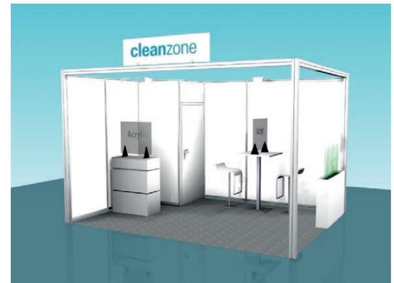
Abbildung exemplarisch für 12 m 2 . Sie erhalten eine individuelle Standskizze.

für Standfläche, Ausstattung/Standbau zzgl. Medienpaket (750 €), Umweltbeitrag (3,90 €/m 2 ), AUMA-Gebühren (0,60 €/m 2 ) und 19% MwSt.